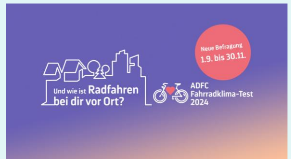
Textquelle: KUS

In Zusammenarbeit mit dem Pfaffenhofener Kreisverband des Allgemeinen Deutschen Fahrradclubs (ADFC) ruft das Kommunalunternehmen Strukturentwicklung Landkreis Pfaffenhofen a.d.Ilm (KUS) Radfahrerinnen und Radfahrer aus dem Landkreis Pfaffenhofen zur Teilnahme am großen ADFC-Fahrradklima-Test 2024 auf. Bewertet werden können unter anderem das Sicherheitsgefühl, die Breite der Radwege sowie die Erreichbarkeit der Ziele mit dem Rad. Schwerpunktthema ist in diesem Jahr zudem das Miteinander im Verkehr.