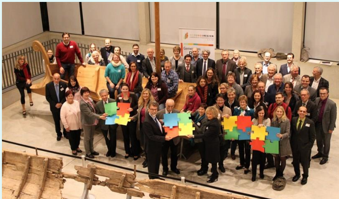
Teilnehmer der Bildungskonferenz

Gemeinsam für die Bildungsregion Landkreis Pfaffenhofen a.d.Ilm“ lautete das Motto der ersten Bildungskonferenz des Landkreises Pfaffenhofen am 25. November 2016 im kelten römer museum manching. In drei Arbeitsgruppen konnten sich Vertreter der Bildungseinrichtungen und Bildungsträger im Landkreis, Vertreter der Kammern und der Arbeitsagentur, Wirtschaftsvertreter, Kreisräte,